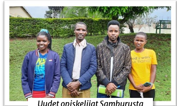
Uudet opiskelijat Samburusta