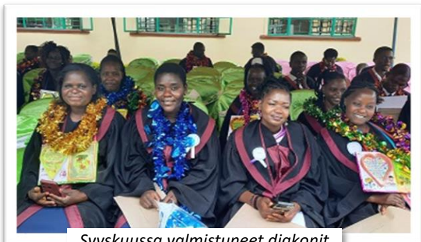
Syyskuussa valmistuneet diakonit

Sleyn kautta keskitymme pääasiassa tukemaan Samburu-alueelta tulevien opiskelijoiden koulutusta. Uusia opiskelijoita saatiin tähän joukkoon tänä syksynä neljä, kun sekä diakoni- että evankelistaopintoihin hakeutui kaksi opiskelijaa. Lisäksi opintojaan on päättämässä yksi diakonian jatko-opiskelija. Näiden neljän uuden opiskelijan sertifikaattitason opinnot kestävät kaksi vuotta, jonka jälkeen heillä voi olla mahdollisuus hakeutua jatkamaan opintojaan seuraavalle tasolle (diploma). Evankelistaksi opiskelevien kohdalla tämä tarkoittaisi opintojen jatkamista papiksi asti. Rukoillaan, että nämä nuoret opiskelijat voisivat keskittyä opintoihinsa hyvin, ja että kutsumus seurakunnan työntekijän tehtäviin voisi opiskelujen myötä vahvistua.