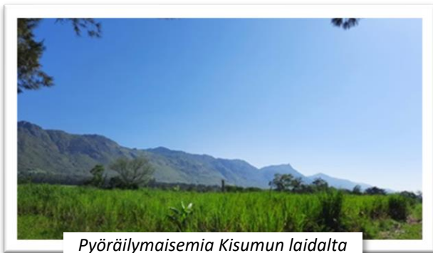
Pyöräilymaisemia Kisumun laidalta