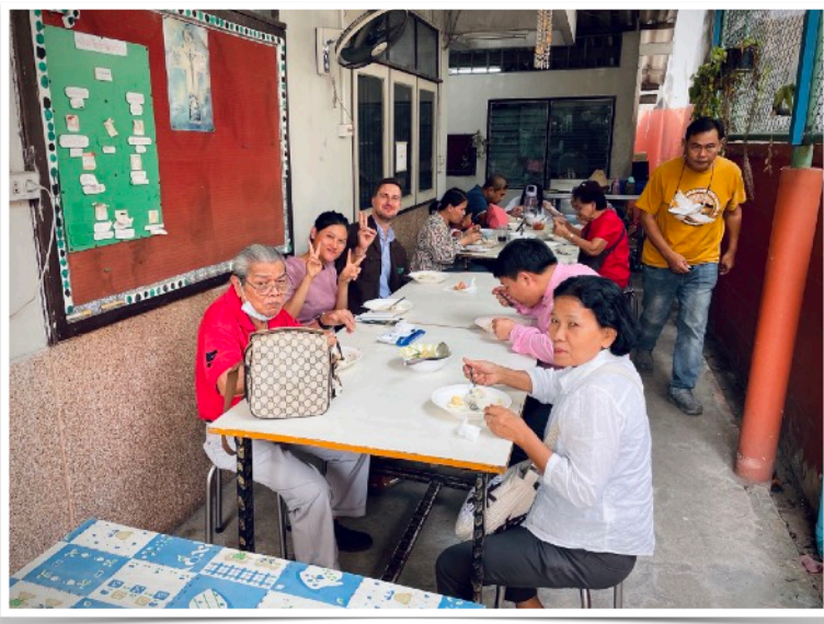
Kuvassa: Thaimaan seurakunnissa syödään jumalanpalveluksen jälkeen usein yhdessä lounasta.

Seuraa meitä Instagramin ja Facebookin kautta. Lähetämme viikoittain kuvia ja uutisia töistämme ja elämästämme. Instagram: toivasetmissio. Facebook: Toivaset Missio