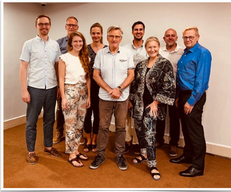
Kuvassa: Kuvassa poseeraa yhdessä Suomen lähetysseuran Aasian lähettien kanssa. Jumalan valtakunnan työssä on erityisen tärkeää, että emme näe toisiamme kilpailijoina, vaan yhteisen työn tekijöinä. Jumala toimii meistä huolimatta ja on luvannut itse viedä meistä riippumatta työnsä päätökseen ennen uuden aikakauden alkua. Tästä lupauksesta saamme iloita yhdessä ja kiitollisena auttaa ja palvella omia lahjojamme käyttäen.

huolimatta taustalla oleva tavoite on opettaa vastuullista rahankäyttöä, läpinäkyvää ja hyvää hallintoa sekä toiminnan tavoitteellista suunnittelua. Vaikeinta kirkkojen työssä on kuitenkin se, että työn tuloksia kuvaillaan pääosin laadullisesti: Ruoka-avun ja koulutuksen toimintaa voi kehittää ja mitata tavoitteellisesti, mutta uskoa ja rakkautta ei voi punnita. Hyvän paimenen vertauksella Jeesus haluaa opettaa kuulijoilleen, että yksikin ihminen on Jumalalle tärkeä. Diakonian rinnalle tarvitaan aina opetus- julistus- ja evankelointityötä tukevaa ja rohkaisevaa toimintaa. Sley'n työn painopiste Kaakkois-Aasiassa onkin tällä hetkellä teologisen koulutuksen kehittäminen, pappien sekä opettajien koulutus ja lapsityön tukeminen. Olen kokenut, että alueella on ainakin MMF:n esitelmien mukaan hyvä tasapaino diakonian sekä ilosanoman julistamiseen painottuvaa toimintaa. MMF:n merkitys on toisaalta myös verkostoituminen ja yhteinen ideoiden jakaminen. On innostavaa nähdä ja kuulla siitä, miten lähetystyötä tehdään lähimaissa ja saamme olla iloisia siitä, että vaikka työskentelemme eri järjestöissä ja kirkoissa, meillä kaikilla on yhteinen Herra ja yhteinen tavoite.