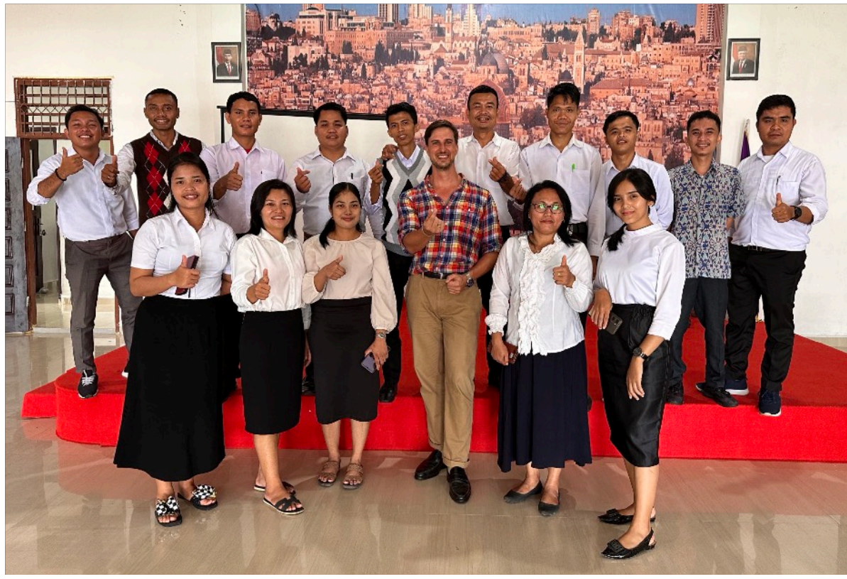
Kuvassa: Pastoraaliseminaarin opiskelijat valmistautuvat kolmen kuukauden jatko-opintojen aikana aloittamaan seurakuntatyön harjoittelun. Harjoittelu kestää 3 vuotta kolmessa eri seurakunnassa.

kasvatetaan aktiiviseen ja hyvään elämään? Tällainen kasvatusero (ks. Gal. 3:24) saattaa toimia tiettyyn ikäkauteen asti, sillä tiedämme kyllä, että lapsille ja nuorille on helppo sanoa hyvien valintojen johtavan taivaalliseen palkintoon ja huonojen valintojen puolestaan rangaistukseen. Ihmisen varttuessa tällainen ”uhkailu, lahjonta ja kiristys” Jumalan kasvatuserona tai käsitys ihmisiä vakoilevasta ”joulupukkijumalasta” alkaa tuntua yksinkertaiselta ja lapselliselta. Joskus se saattaa johtaa jopa eräänlaiseen taikauskoon, jolloin ihminen ajattelee että jokin onnettomuus tapahtui hänelle erityisenä taivaallisena rangaistuksena juuri siksi, että hän teki jotain syntiä jonain päivänä. Jos ihminen uskoo saaneensa kasteessa täydellisen ja uudestisyntyttävän armon, pitääkö hänen kuitenkin jatkuvasti pelätä menettävänsä kasteen armon pitääkseen yllä motivaatiota tehdä hyviä tekoja ja olla hyvä ihminen?