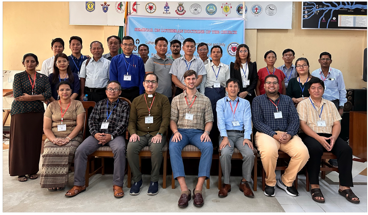
Kuvassa: Luterilaisen kirkko-opin seminaari Myanmarin luterilaisten kirkkojen federaatiossa. Oli hienoa ja haastavaa keskustella kolleegojen, sisarten ja veljien kanssa, joiden arkipäivää varjostaa vaikea sosio-poliittinen kriisi.