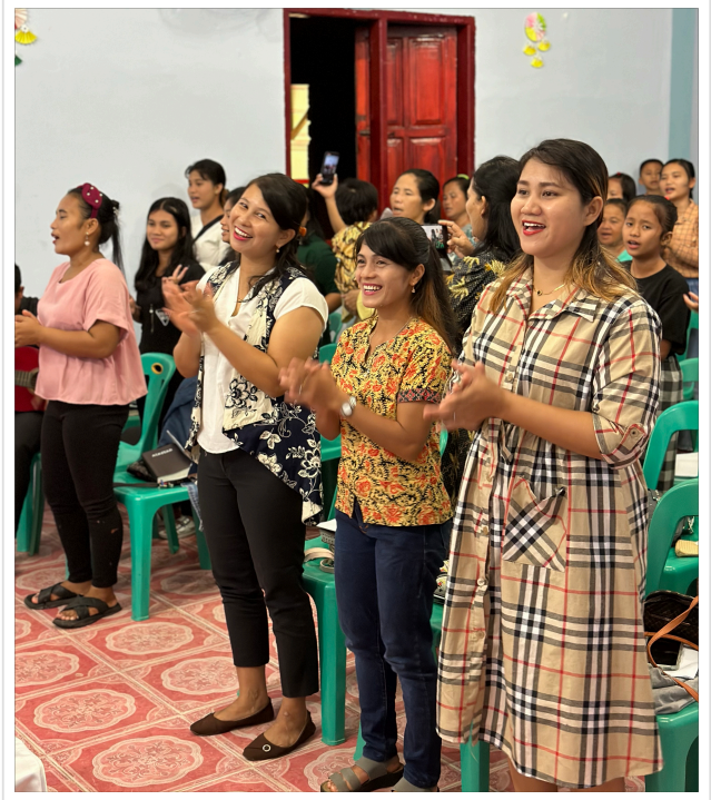
Kuvassa: Nuoria pyhäkoulunopettajia Sibolgassa.