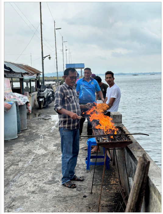
Kuvassa: Muslimiravintola laiturin varrella. Miehet grillaavat herkullista chilillä ja kookoskermalla maustettua kalaa hiillillä.

Sibolga on kaunis ja yllättävän puhdas kaupunki Pohjois-Sumatran länsirannikolla. Se on noin 100000 asukkaan kaupunki, mutta kaduilla kävellessä kokonaisvaikutelma tuo mieleen pienen merenrantakylän. Sibolgassa on monipuolisesti luonnon kauneutta: Kaupunkia ympäröivät kolmelta reunalta vehreät vuoret, sen läpi virtaa joki ja sen länsipuolelle avautuu Intian Valtameri. Kaupunkilaiset ovat erittäin ylpeitä kaupunkinsa monikulttuurisuudesta ja moniuskonnollisuudesta. Meille kerrottiin useasti kuinka hienosti buddhalaiset, muslimit ja kristityt elävät yhdessä kaupungissa sulassa sovussa. Paikallisella luterilaisella kirkolla on kaupungissa kaksi kirkkorakennusta ja tällä hetkellä seurakuntia palvelee yksi pappi sekä pappiskokelas. Molemmat kirkot sijaitsevat köyhillä asuinalueilla. Yksi on merenrannan lähistöllä ja se on nyt kaupungin tuen avulla remontoitu ja rakennettu luonnonkivistä kasatun lujan perustuksen päälle. Samalla paikalla sijainnut vanha kirkkorakennus oli aiemmin rakennettu rantaan paalujen varaan. Kirkkoa ympäröivistä hökkelitaloista suurin osa seisoo vieläkin vain paalujen varassa. Täällä köyhillä asuinalueella talot on rakennettu niin lähelle toisiaan, että niiden ulkoseinien väliset kujat ovat tuskin metrin levyisiä. Suomalaisilla paloturvallisuusviranomaisilla olisi