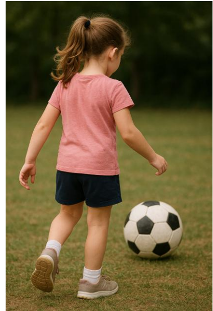
Tekoölyn näkemys jalkapalloilevasta tytöstä

Haluaisitko olla mukana yhteisessä evankeliumin työssä? Jos haluat tukea Pentti Marttila työtä, voit laittaa haluamasi summan Sley'n lahjoitustilille IBAN: FI13 8000 1500 7791 95 BIC: DABAFIHH.