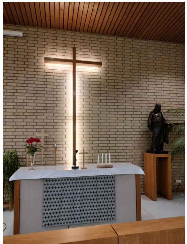
Hämeenlinnan Luther-talon alttari