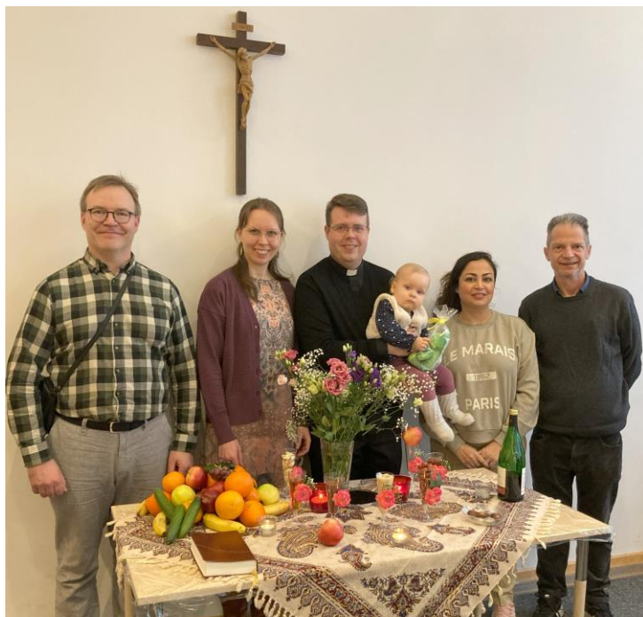
Persialainen uusi vuosi. Koristeltu juhlapöytä häft-sin kuuluu asiaan. Persialaiset jakavat lapsille lahjoja Nowruz-juhlassa.

(Joh. 20:19) Pyydän erityisesti esirukousta näiden nuorten miesten puolesta, että he saisivat pian tulla pyhässä kasteessa Jumalan lapsiksi ja taivaan perillisiksi.