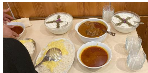
Persialaisten äitien lihapatojen äärellä eli nowruz-juhlan ruokaa. Huomaa mintusta tehdyt ristit jugurttikastikkeen päällä.