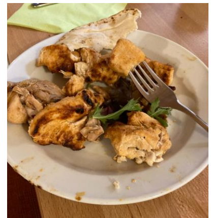
Persialaiset ovat mestareita ruuanlaitossa. Leirin lauantai-illan grilliherkkuja.

Leirin teemana olivat Jeesuksen vertaukset, joita käsitelimme raamattuopetuksissa viikonlopun aikana. Yhtenä tärkeänä asiana opimme, että vertauksen voi paremmin ymmärtää, kun selvittää, kenelle Jeesus vertauksen esittää, ketkä ovat vertauksen kuulijat. Viikonlopun aikana sitten kätketyt aarteet, valo ja suola, viinitarhan työntekijät, eksyneet lampaat, kadonneet kolikot, tuhlaajapoika ja hänen veljensä sekä kuninkaanpojan häät tulivat tutuiksi. ”Vakavan” oppimisen lisäksi oli tietysti pelejä ja leikkejä sekä lauantai-illan kohokohtana persialaista kebabia, grillissä paahdettuja herkullisia kanavartaita, jotka