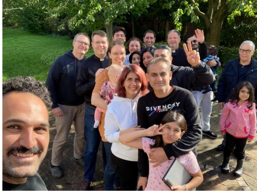
Seurakuntien yhteisellä persiankielisellä leirillä oli hauskaa.