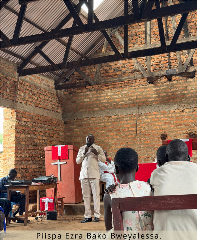
Piispa Ezra Bako Bweyalessa.