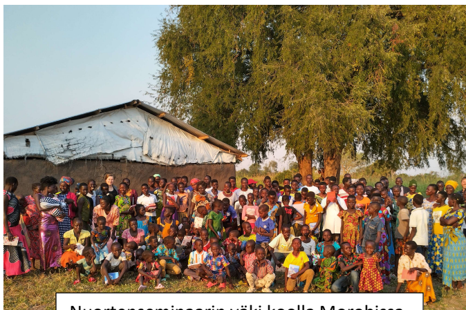
Nuortenseminaarin väki koolla Morobissa.

Olimme varautuneet noin 50 osallistujan seurakuntaa kohti, mutta paikalla oli tuplasti enemmän väkeä. Ruokaa riitti silti kaikille ja joka päivä opetukset venyivät iltaan asti, sillä kysymyksiä ja keskustelua oli paljon.