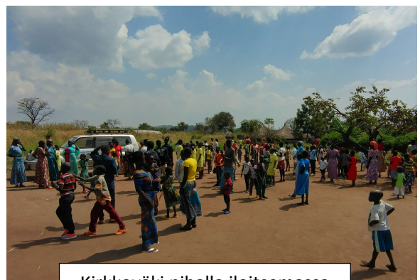
Kirkkoväki pihalla iloitsessa joulumessun jälkeen.