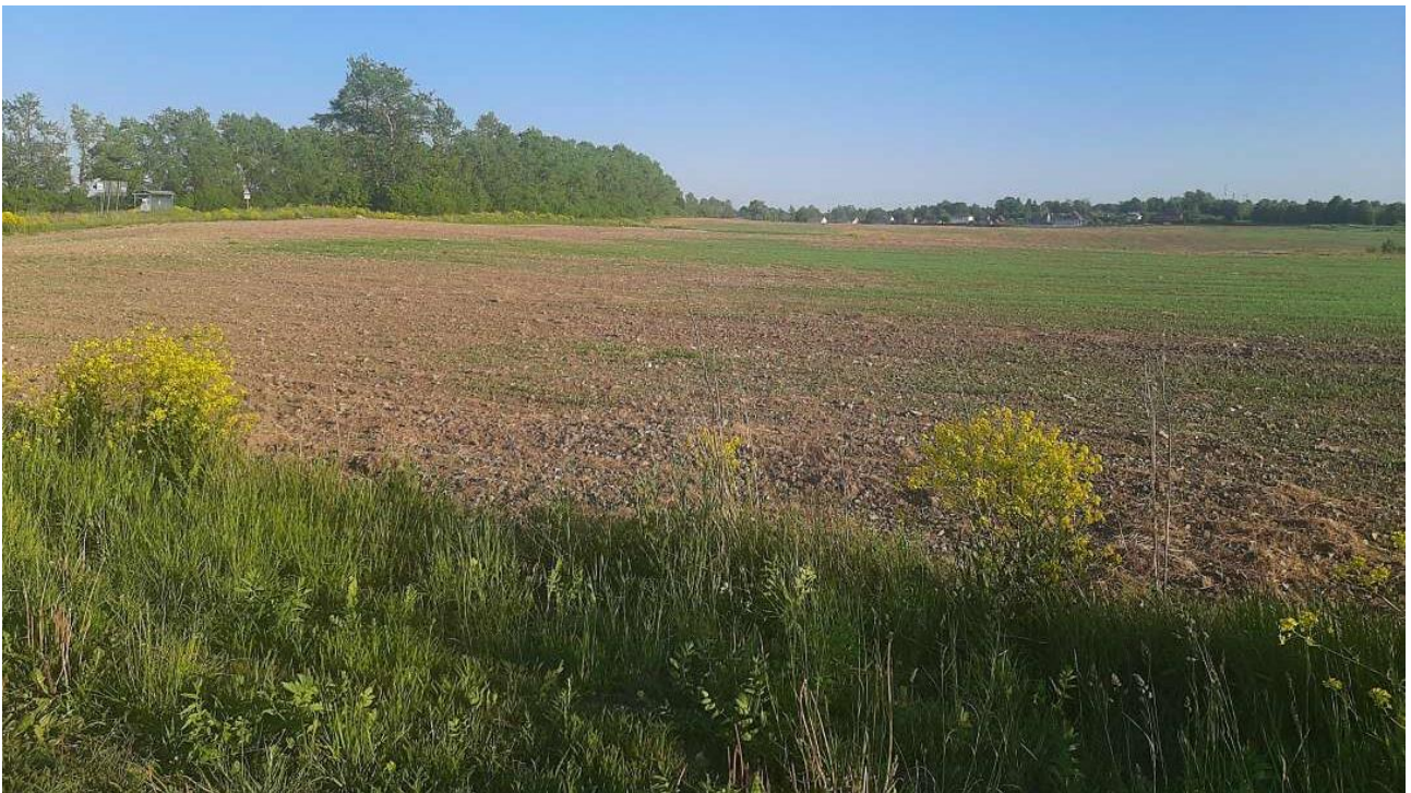
Pahasti kuivunut pelto Tuutarin kirkon lähellä

Eräs seurakuntalainen kertoi, että perunat istutettiin kuukautta aikaisemmin, mutta mitään ei ollut vielä noussut. Kun hinnat ovat nousseet, monen eläke on liian pieni kaiken ruuan ostamiseen kaupasta. Eräs ystävä sanoi, että hän katsoo, missä on millaisiakin tarjouksia ja ostaa vain tarjousruokaa.