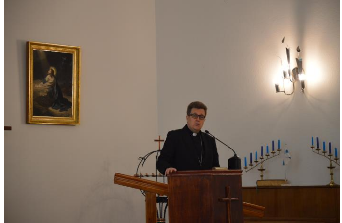
Lahden Lutherin kirkko 09.05.2022