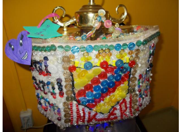
Krasnojarskin kirkko 29.11.2022