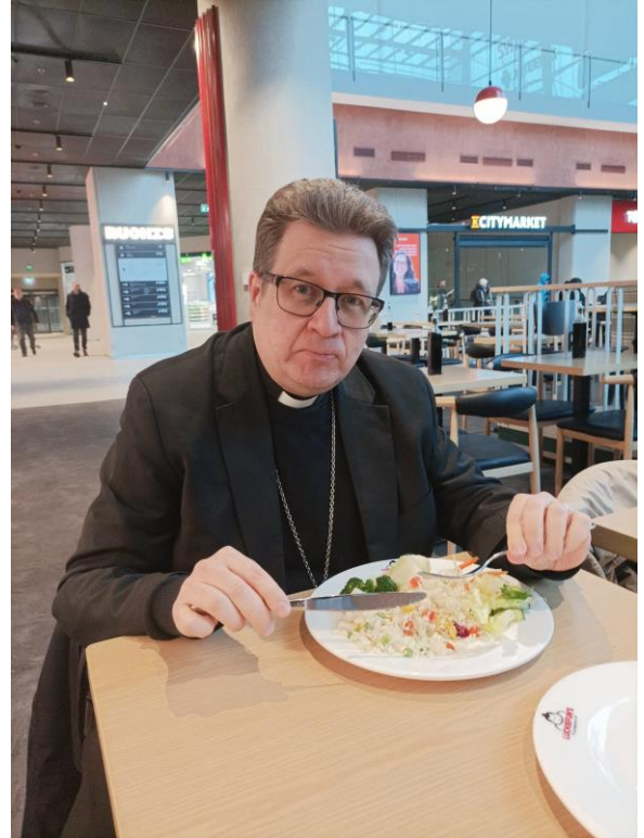
Helsingissä 12.3.2026.