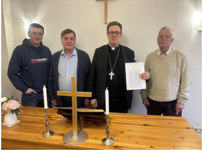
Omsk 18.03.2026