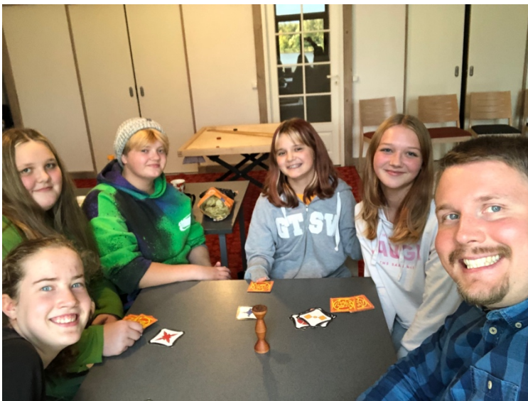
Räpinan ensimmäisen nuortenillan meininkiä.