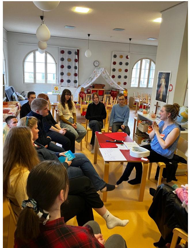
Salomen vetämä „Rakkaus ja ihmissuhteet“ työtupa herätti suurta kiinnostusta

Taiteellisessa työtuvassa nuoret taas pääsivät maalaillemaan päivän teemasta: rauha. Nuorten henkilökohtaisten teosten lisäksi alkoi muotoutumaan yhteisteos, jota on tarkoitus jatkaa vielä jossain tulevassa tapahtumassa.