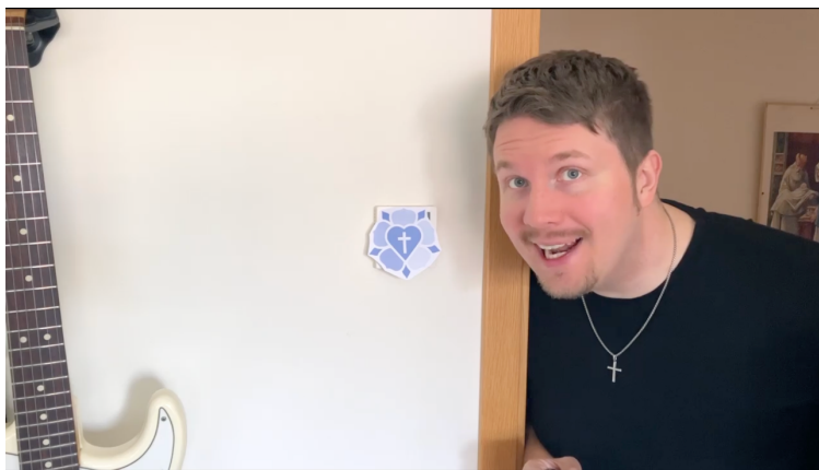
Ruutukaappaus nuorten rippileirin mainosvideolta, jonka kuvasimme yhdessä nuortemme kanssa somessa jaettavaksi.

Leirin teemaksi valikoitui "Myrskyissä kannateltu", mutta toivottavasti ilmat hellisivät eikä jouduttaisi myrskyilmojen kanssa teltoissa leireilemään. Suurta stressiä aiheuttanut leiripaikan etsimisprosessi saatiin lopulta toukokuun alussa päätökseen. Meidän budjetille liian kalliin tarjouksen tehnyt "turismitalon" emäntä sanoi, että tehdään sitten ruoka sillä