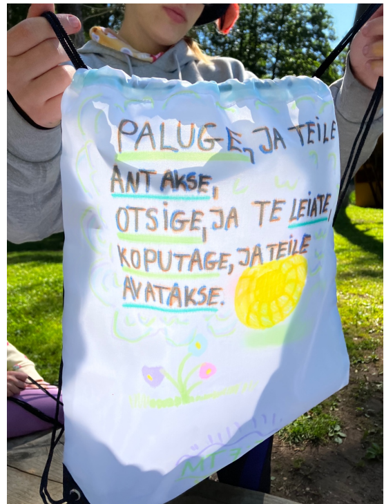
„Pyytäkää, ja teille annetaan, etsikää ja te löydätte, koputtakaa ja teille avataan“