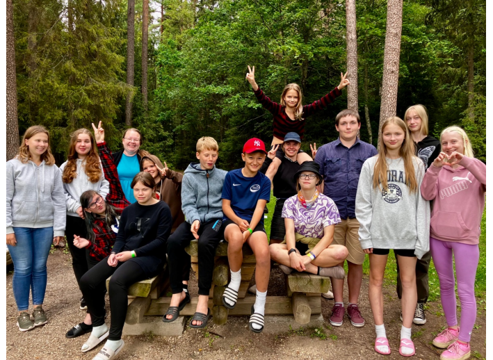
Yhden kesäleirin nuortenporukka.

Jo edellisvuosina olemme tiedostaneet haasteen siitä, että kesän leirit jäävät monille nuorille valitettavasti vuoden ainoaksi kohtaamiseksi seurakunnan ja sen sanoman kanssa. Kuinka voisimme varustaa tällaisia nuoria? Tällä kertaa nuoret saivat leirin lopuksi suunnitella ja toteuttaa itselleen koristellut repun, johon he saivat valita itselleen sopivan rohkaisevan raamatunkohdan. Rohkaisimme nuoria tuon muistolauseen avulla muistamaan mikä turva meillä on Jumalassa sitten kun elämän myrskyt sattuvat omalle kohdalle. Hienoja reppuja nuoret suunnittelivatkin ja leirimuisto tuntui olevan oikein mieluinen kotinvietävä.