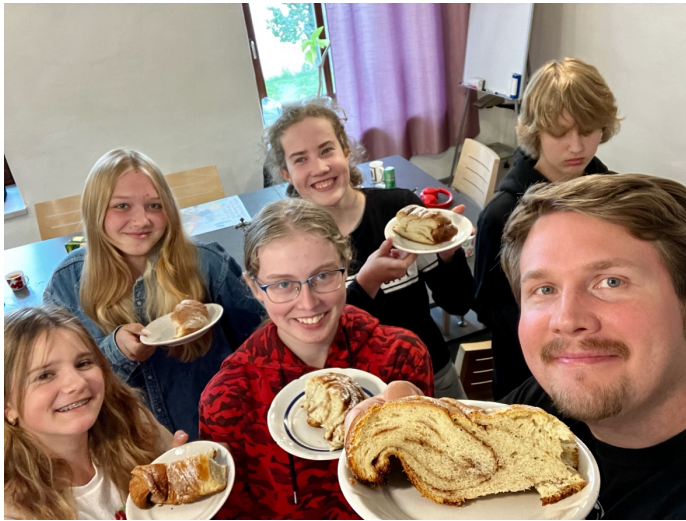
Räpinan syksyn ekaan nuorteniltaan haettiin tuoreet pullat kahvilasta