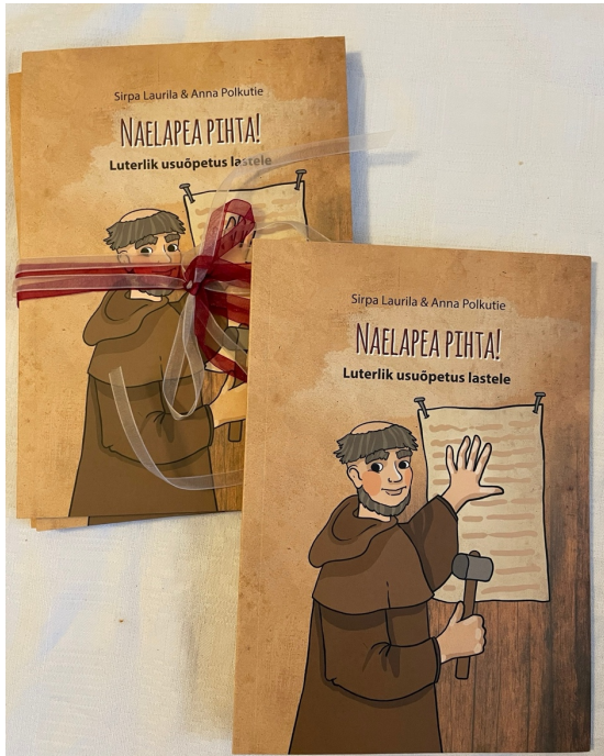
Uusi lastenkirja viroksi