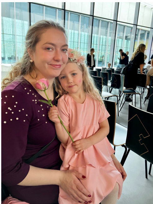
Sointu sai konserttinsa jälkeen kukkasen ja pääsi rakkaan äidin syliin