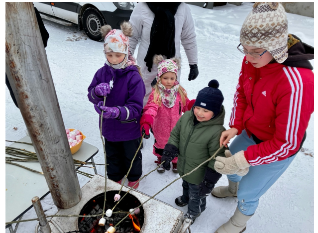
Räpinan perhepäivän väkeä paistamassa vaahtokarkkeja