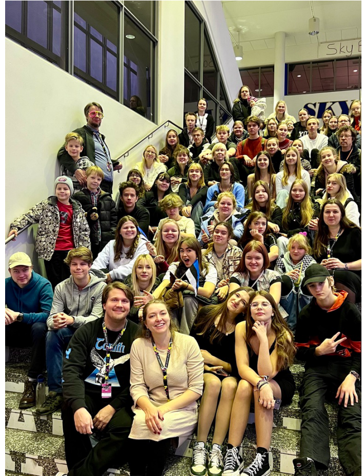
Viron porukka Turussa Maata Näkyvissä - festivaaleilla

Turussa meidän nuoremme saivat aikamoisen kokemuksen, kun pääsivät tuhansien muiden nuorien kanssa riemuitsemaan, kun kymmenet bändit, puhujat ja tanssijat julistivat Jumalasta, joka ei jätä meitä yksin. Tuntui, että sanoma kolahti.