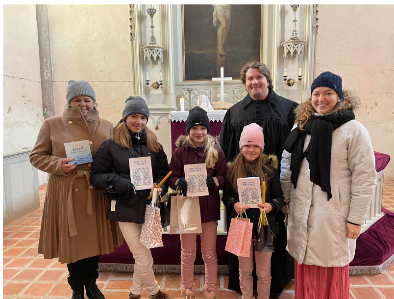
Juuri kastetut siskokset ja kummit Puhjan kirkossa

Viron kirkoissa kastetilaisuuteen ei ole usein mahdollista pukeutua kovin juhlavasti, sillä kirkoissa on kylmä. Nytkin kirkon kaikkia ulko-ovia pidettiin auki jumalanpalveluksen aikana, että ulkoa tulisi lämpimämpää ilmaa sisään! Ulkona oli +4c, mutta isot kivikirkot muistivat vielä edellisviikonovat pakkaset.