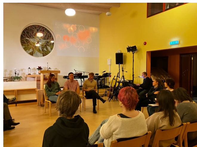
Pölvän nuorten kanssa vierailulla Võrussa

Joulukuun alussa pääsimme nuortemme kanssa jännittävälle vierailulle. Aiemmin syksyllä Pölvassa järjestetyssä perhepäivässä oli syntynyt kontakti, jonka seurauksena saimme kutsun suhteellisen lähellä sijaitsevaan Võrun kaupunkiin metodistiseurakunnan nuorteniltaan. Täällä nuorten porukat ovat pienet ja oli hyvä tuoda nuoria yhteen hyvän sanoman äärelle. Saimme Võrussa nähdä miten pitkäjänteinen nuorisotyö voi kantaa hedelmää. Vierailu oli oikein mukava ja lämminhenkinen ja saimme sieltä uusia ystäviä.