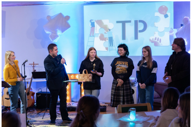
Pöltsamaaan talvipäivien meininkiä