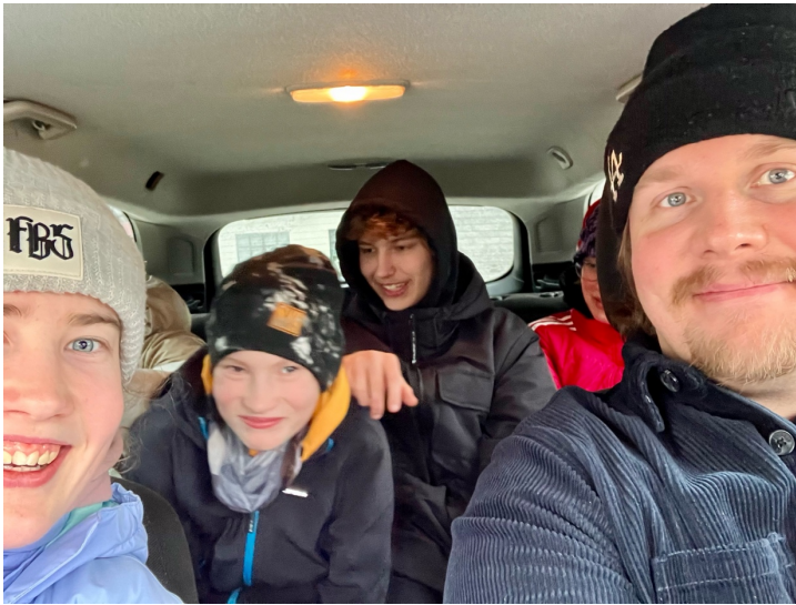
Täysi autollinen nuoria menossa pääsiäistäpahtumaan

jossa eräs seurakunnan vanhempi rouva kysyi tavan mukaan eräältä nuorelta mitä kuuluu. Kun nuori vastasi kysymykseen rehellisesti tokaisi rouva hänelle takaisin: ”Älä puhu tuollaisia.”