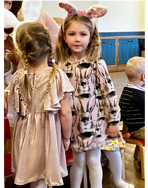
Meidän Sointu laulavana pupuna päiväkodin pääsiäisnäytelmässä

Viro on tutkimusten mukaan yksi maailman uskonottomimmista maista ja saattaakin yllättää, että tästä huolimatta kalentereista löytyy samoja kristillisiä juhlapyhiä, mitä Suomessakin. Loppukevät on näiden suhteen runsas pääsiäisen pyhineen, helatorstaineen ja helluntaineen. Harva täällä kuitenkaan tietää ja ymmärtää, mistä näissä juhlapyhissä on pohjimmitaan kyse. Tuskin Suomessakaan kaikilla on kirkaana mielessä helatorstain sanoma, mutta tilanne on silti aika erilainen Virossa, jossa yleistä uskononopetusta kouluissa ei ole ja rippikoulu käydään useimmiten aikuisena, jos silloinkaan. Kansan parissa kristillisille juhlapyhille on myös omia maallisia nimiä, jotka monet ainoastaan tuntevat. Pääsiäisen aikaan silmään pisti sosiaaliseen mediaan tehty video, jossa Tallinnan helluntaiseurakunnan nuori kyseli Tallinnan kaduilla ihmisiltä pitkänäperjantaina mikä päivä tänään on. Jotkut osasivat yhdistää päivän merkityksen oikeaan uskontoon ja jotkut henkilöönkin, mutta monella se oli vielä mysteeri.