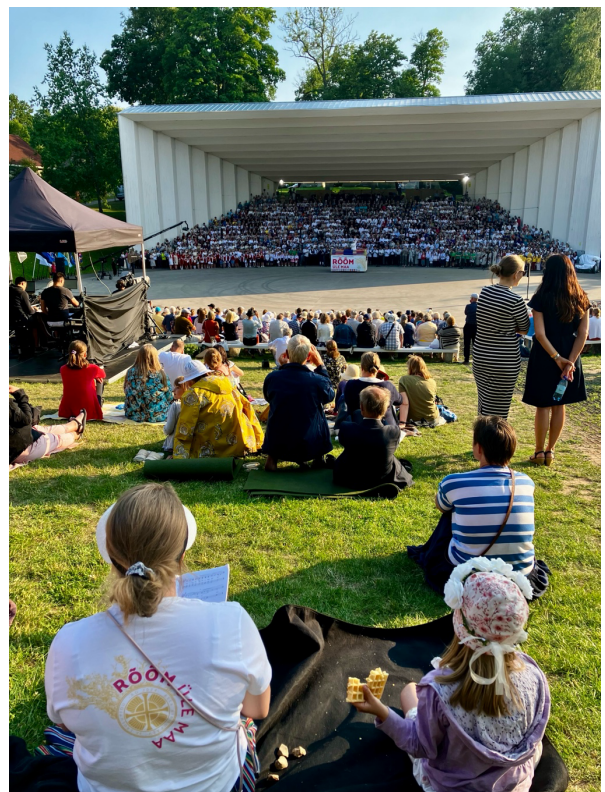
Hengelliset laulujuhlat meneillään