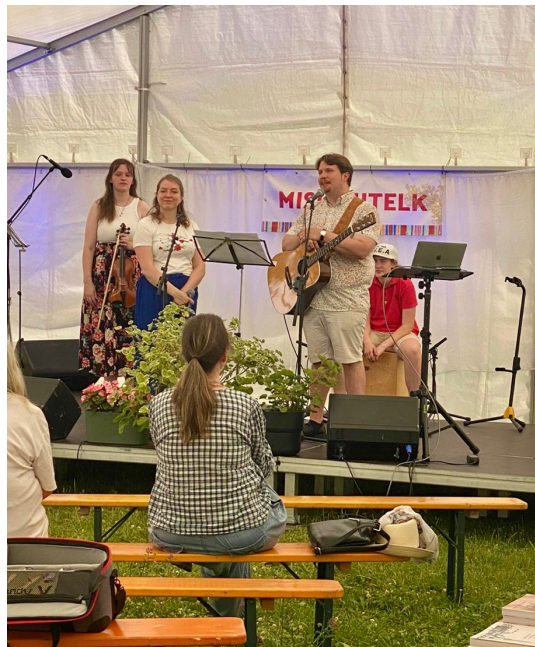
Pölvän bändikerho esiintymässä Viljantissa

Kirkkopäivien jännittävimpiä hetkiä oli (ainakin meidän nuorillemme) esiintymisemme lähetysteltassa. Esitimme yhteensä neljä laulua, joista kaksi olivat omia käännöksiämme. Osa nuoristamme ei ollut aikaisemmin koskaan esittäneet musiikkia missään... ja ihan hyvin meni! Tärkeimpänä tästä jäi positiivinen kokemus nuorillemme. Harmi etteivät kaikki päässeet paikalle, vaan osa joutui jättäytymään pois aivan viime metreillä. Musiikilla on kyllä tärkeä rooli myös lähetystyössä!