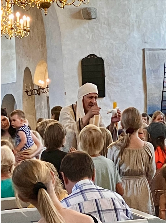
Kadonnut lammas löytyi Viljantissa!