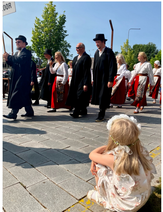
Meidän Sointu seuraamassa kuorojen kulkuetta Viljantin lauluvalalle

Kesä alkaa olla takanapäin ja syyskauden työkuviot ovat jo alkaneet. Tänä syksynä suunnitelmissa on vielä tärkeitä ja merkittäviä asioita tekemämme lähetystyön kannalta.