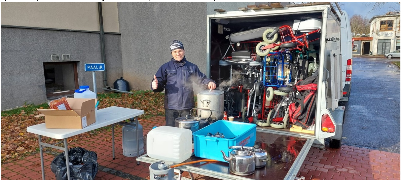
Pasi ja auto. Iso pakettiauto ja peräkärry olivat ladattu aivan täyteen vanhuksien apuvälineitä.

Monet vanukset ilahtuivat suuresti, kun saivat kuulla saavansa uudet elämää helpottavat apuvälineet ja saimme toivottaa heille Jumalan siunausta. Ajatella miten hienoja asioita saadaan aikaan, kun aivan tavalliset kristityt saavat sydämelleen halun auttaa heille täysin tuntemattomia läheisiä. Paljon voi pienikin porukka saada hyvää aikaan, kun Jumala on puolellamme.