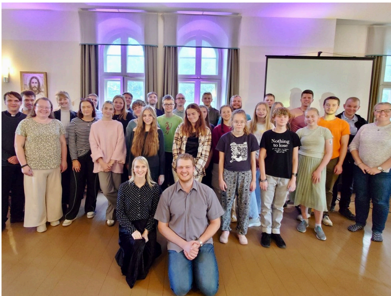
Paavalin nuortenpäivien nuoria.