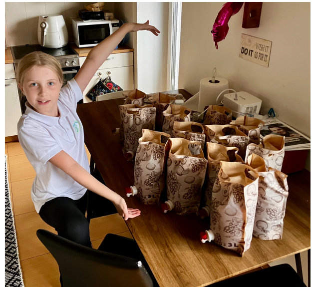
Sofia ja 66 litraa oman pihan omenamehua

Perhepäivillämme on sen ilmeisen merkityksen lisäksi ollut myös tärkeä yhteyttä luova vaikutus täällä meidän elinpiirissämme. Perhepäivän monissa vastuutehtävissä oli pyhäkouluopettajia monista eri seurakunnista, jotka tavallisesti työskentelevät omassa roolissaan aika yksin. Yhdessä tekeminen antaa paljon myös tekijöilleen. Lisäksi saimme vieraiksi monet jo ennestään tutut ja muutaman uudenkin vapaaehtoisen Suomesta, jotka halusivat tulla auttelemaan meitä. Iso kiitos myös näille Esikoiset ry:n vapaaehtoisille!