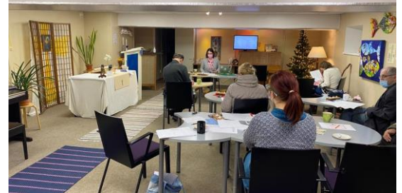
Minun persoonani -koulutus Lasnamäellä