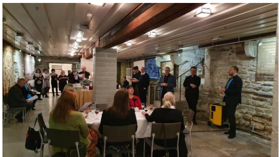
Tuomiokirkkoseurakunnan työntekijöiden ja vapaaehtoisten joulujuhla loppiaisen jälkeisenä sunnuntaina