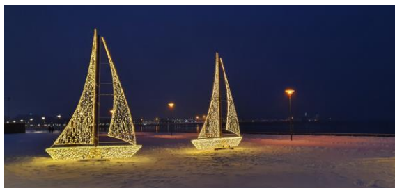
Tallinnan rantabulevardia kaunistavat tänä talvena valoneet.