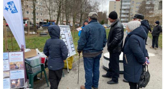
Lasnamäen adventtitapahtumissa kutsuimme pelin avulla tutustumaan jouluvideoihin.

Osallistuin sunnuntaina ensin jumalanpalveluksen aika varhaisnuorten pyhäkouluun, johon lupauduin kevään ajaksi ainoan vetäjän avuksi. Tuomikirkossa pyhäkoulua pidetään joka toinen sunnuntai kolmessa ryhmässä: pienet lapset, koululaiset ja varhaisnuoret. Pyhäkoulu kestää koko messun