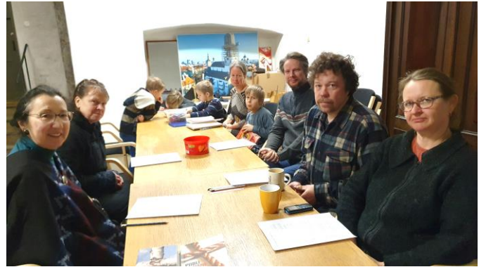
Vuoden ensimmäinen raamattutunti Tuomiokirkossa

Koko Raamatun tiivistäminen seitsemään–kahdeksaan tuntiin on aika haastava tehtävä, mutta tavoitteeni on, että kurssi antaisi kokonaiskuvan Raamatusta ja sen alusta loppuun kulkevasta Jumalan pelastussuunnitelmasta. Kun on parempi ymmärrys kokonaisuudesta, on toivottavasti helpompi myös itse tarttua Raamattuun ja syventyä siihen, mistä kurssilla ehdimme raapaista vain pintaa. Kun muutama vuosi sitten pidin raamattutunteja Rakveressa ja luettiin Jesajan kirjaa, muistan erään seurakuntalaisen innostuksen, kun hänelle selvisi, että Vanhassa testamentissakin puhutaan Jeesuksesta ja Raamatun läpi kulkee yhtenäinen punainen lanka. Tämän punaisen langan äärellä vietän nyt tiivistä helmikuuni, koska ensimmäinen versio kurssista pitäisi olla valmiina pidettäväksi 25.-26.2. Myös Tuomiokirkkoseurakunnan kuukausittaisilla raamattutunneilla kokoonnutaan tämän saman teeman äärelle.