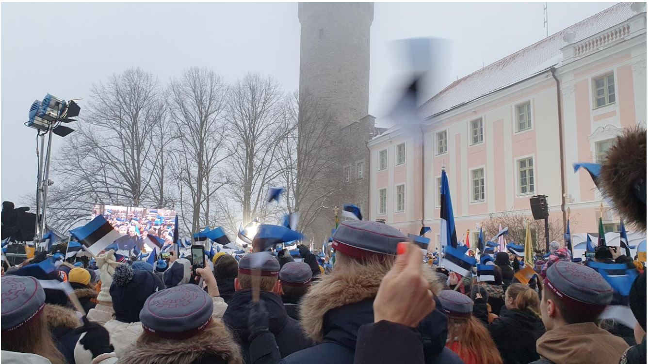
Itsenäisyyspäivän (24.2.) lipunnoston tunnelmia Pitkän Hermannin tornin juurella