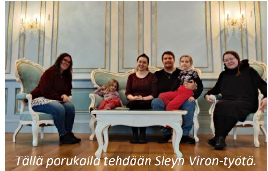
Tällä porukalla tehdään Sley'n Viron-työtä.

Loman jälkeen suuntasin viikonlopuksi Karkkuun, jossa saatiin hyvällä porukalla tutkia Malakian kirjaa Pienellä suurella raamattukurssilla samalla, kun valtaosan talosta täyttivät Maata Näkyvissä junior -leiriläiset. Melkein suoraan Suomesta matka jatkui vielä Riikaan, jossa pidimme tämänvuotisen Sley'n Viron-työalueen kevätkokouksen. Arjesta irrottautuminen kahden eri maan verran tuli tarpeeseen.