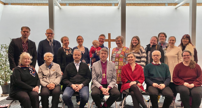
Maaliskuussa kokoontuimme myös lähettienpäivään.

heiluteltiin yhden pyhäkoulunopettajan kotipihalta harvennetun tuijan oksia. Messun jälkeen nautittiin harvinaiset kirkkokahvit, ja sitten olikin aika siirtyä kirkon sivuhuoneeseen raamattutunnille. Tällä kertaa enemmän raamattupiirin muodossa tutkimme, mitä kaikkea Jeesuksen ristinkuolema meille merkitseekään.