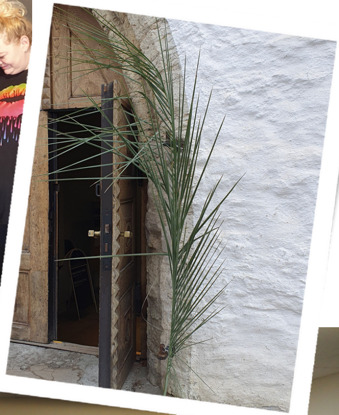
Lasnamäen seurakunnan perustajat