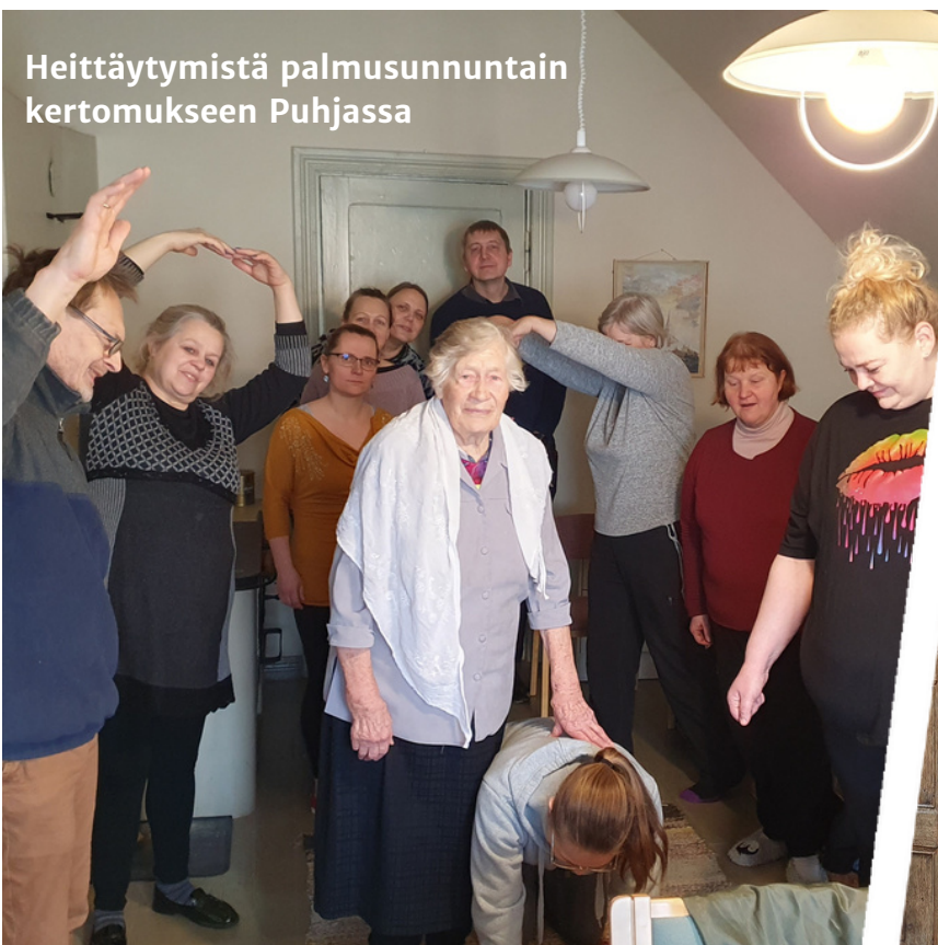
Heittäytymistä palmusunnuntain kertomukseen Puhjassa

heiluteltiin yhden pyhäkoulunopettajan kotipihalta harvennetun tuijan oksia. Messun jälkeen nautittiin harvinaiset kirkkokahvit, ja sitten olikin aika siirtyä kirkon sivuhuoneeseen raamattutunnille. Tällä kertaa enemmän raamattupiirin muodossa tutkimme, mitä kaikkea Jeesuksen ristinkuolema meille merkitseekään.