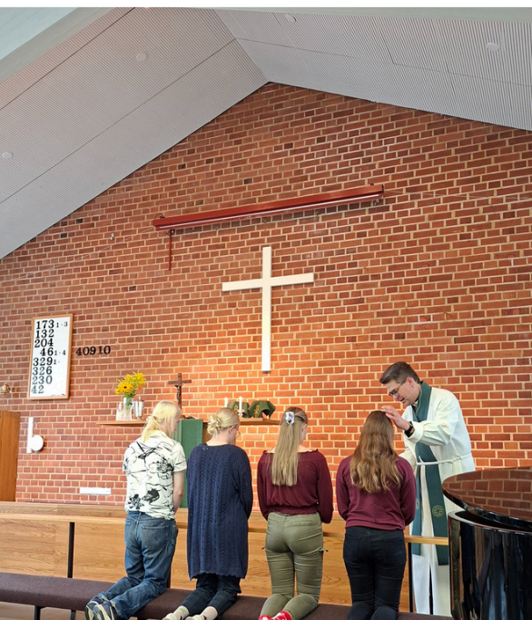
Aktiolaiset siunattiin matkaan Karkun messussa ja he pääsivät suunnittelemaan keinoja tavoittamiseen (kuva alla).