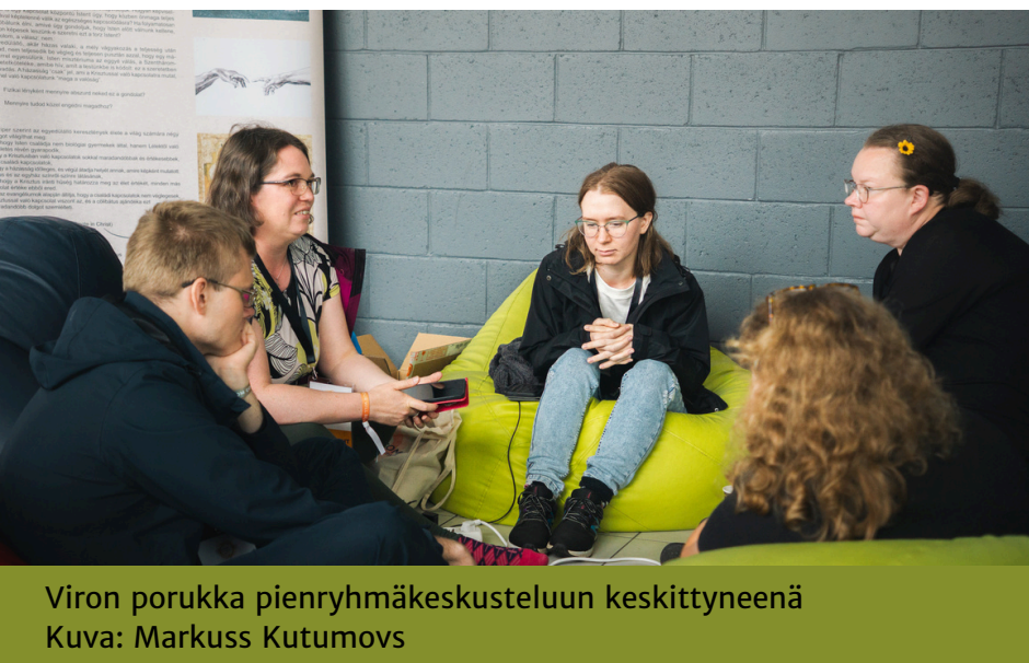
Viron porukka pienryhmäkeskusteluun keskittyneenä

Kuten edellisessä kirjeessä kerroinkin, elokuun puolivälissä viiden hengen Viron opiskelijatyön edustus matkasi Latviaan IFES:n (International Fellowship of Evangelical Students) Euroopan opiskelijafestivaalille. Vajaaksi viikoksi Jelgavaan kokoontui noin 500 opiskelijaa ja opiskelijatyöntekijää yli 30 eri maasta. Isoimpiin Saksan, Unkarin ja Itävallan ryhmiin verrattuna viron joukkomme oli toki pieni mutta kuitenkin suhteellisen iso edustus pienestä opiskelijajärjestöstä – ja suurempi kuin vaikkapa Pohjoismaiden, joista ei ollut osallistujia lainkaan. Oli hienoa seurata paikan päällä ja kuulla jälkikäteen, mitä opiskelijamme kokivat, oppivat ja saivat mukaansa. Lähes päivittäin kokoontuvat pienryhmät oli jaettu maittain, joten pääsimme käymään myös niissä hyviä ja syvällisiä keskusteluja, mikä onnistui paremmin viroksi jo tutulla porukalla kuin englanniksi vieraiden ihmisten kanssa.