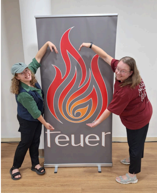
Eliisen ja konfferenssikyltin kanssa

Päätin lähettää kaksi kirjettä aikalailla peräkkäin, ensin tämän opiskelijoihin ja seuraavaksi nuorisotyöhön keskittyvän. Osaksi ne toki limittyvät, koska osa nuorista on mukana opiskelijatyössä ja toisinpäin, joten välillä ollaan molemmissa mukana.