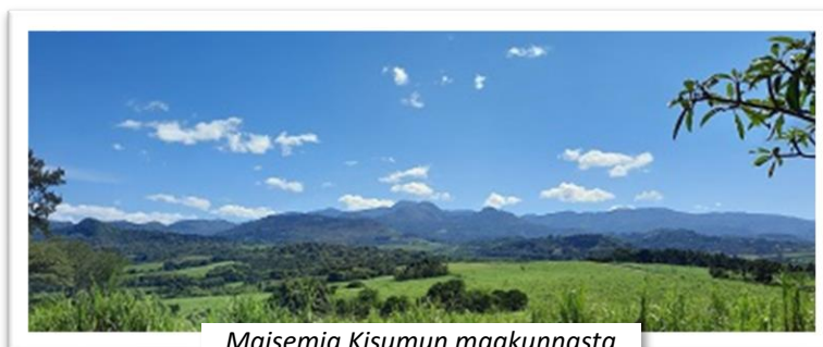
Maisemia Kisumun maakunnasta

Parhaillaan Matongossa on käynnissä koeviikko, joka päättää yli kesän jatkuneen lukukauden. Tämän jälkeen on vuorossa kahden viikon loma ennen seuraavan lukuvuoden alkua. Itselläni ei ole tässä vaiheessa lomaa, vaan keskityn viimeistelemään tulevien kurssien sisältöä sekä hoitamaan muita töitä.