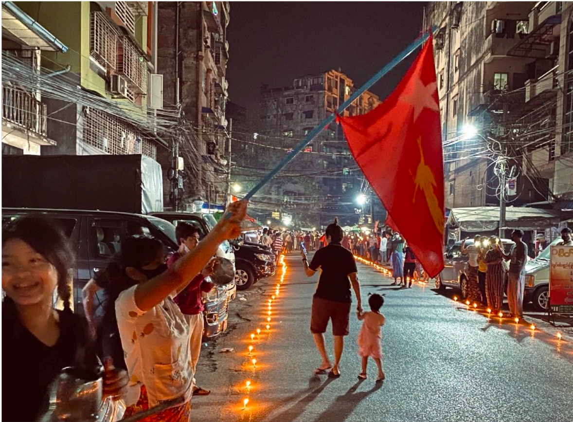
Kuvassa: Mielenosoitukset ovat kasvaneet päivä päivältä. Erityisesti nuoret ja opiskelijat ovat viime päivinä astuneet esiin vallankaappauksen järjestänyttä hallitusta vastaan.