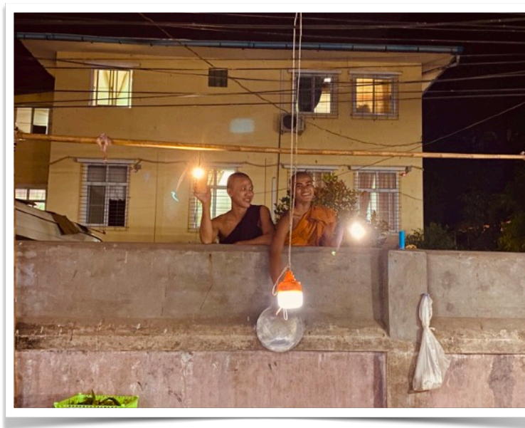
Kuvassa: Kaksi nuorta munkkia osoittavat mieltään luostarin aidan takaa.

Miten erilaisia ja subjektiivisia ovatkaan ihmisten kokemukset vapauden ikävöinnistä väkivallan ja vallankumouksen aikana, jolloin koko yhteiskunta on vaarassa ja jolloin saattaa joutua tilanteeseen, jossa urheus punnitaan? Milloin urheus muuttuu typeryydeksi ja uhkarohkeudeksi, eikä loppujen lopuksi hyödytä ketään? Kuinka hauras onkaan ihmiselämä etenkin aikana, jolloin yhteiskunnallisten rakenteiden Potemkinin kullissit kaatuvat ja tuntee selvästi ettei mikään ole varmaa ja ihmisen hallittavissa?