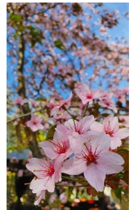
Tallinnan Tuomiokirkko helluntaikoivuineen, parvekepuutarhaa ja helatorstain kirkkomatkan kirsikankukat