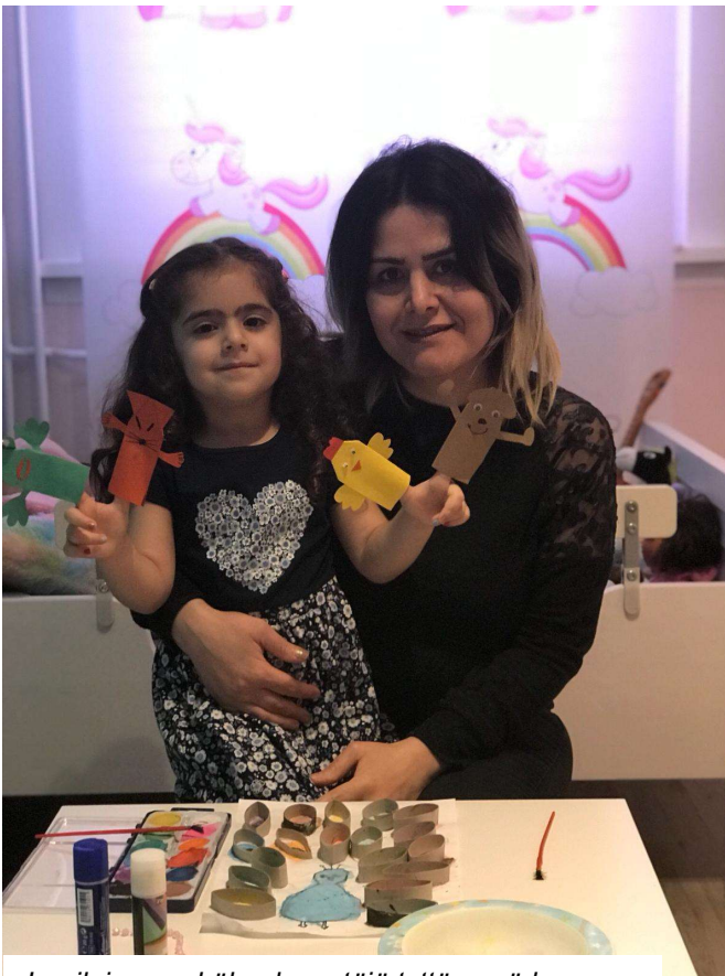
Iranilainen pyhäkoulunvetäjä tyttärensä kanssa kuvaamassa askarteluvideota.