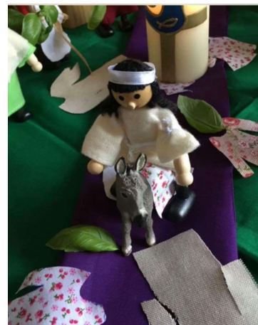
Kuvakaappaus palmusunnuntain pyhäkouluvideolta